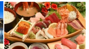
2日目昼食：焼津さかなセンター 刺身定食