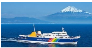
(土肥～清水) 駿河湾フェリー