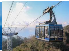
日本平ロープウェイ