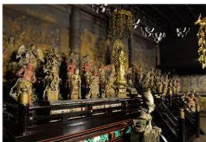
仁和寺「観音堂」 特別内拝

今年の研修旅行は、古都・京都で日本の美しい四季を感じませんか？ 平成の大修理が終了した「仁和寺」にて普段非公開となっている修行の場で重要文化財「観音堂」内部の秋季特別公開に合わせて拝観します。本尊の千手観世音菩薩立像などが見られるほか、内陣の壁画には、六観音、三十三観音菩薩が極彩色に浮かび上がります。また京都で人気の、祇園・東山エリアの寺々を訪れます。ホテルは、京都御所や二条城などの歴史散策、河原町や祇園などの繁華街へも徒歩圏内の便利なホテルです。皆様お誘い合わせの上、是非ご参加ください。